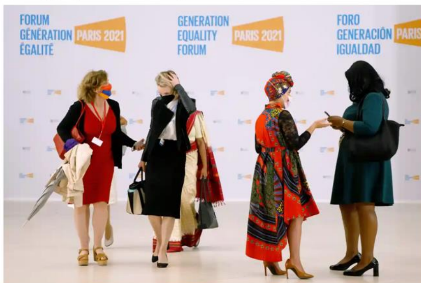
▲ Participants at the Generation Equality Forum in Paris. It takes place amid concerns of an estimated additional 47 million women falling into extreme poverty due to Covid.

Generation Equality Forum in Paris announces plans to radically speed up progress on women's rights