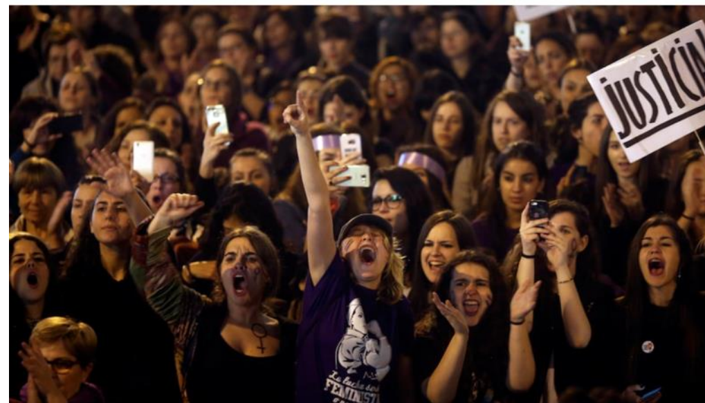
Des milliers de femmes manifestent en Espagne pour dénoncer les violences faites aux femmes.

40 milliards de dollars de l'ONU pour promouvoir les droits des femmes