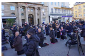
Croatie 2024 : hommes en prière pour la re-virilisation des hommes

Le monde avance trop lentement vers l'égalité des sexes, l'un des 17 piliers des Objectifs de Développement Durable à atteindre en 2030, adoptés par l'ensemble des membres des Nations Unies en 2015.